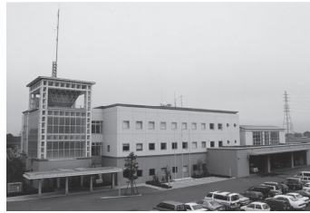
消防本部 鴻巣消防署