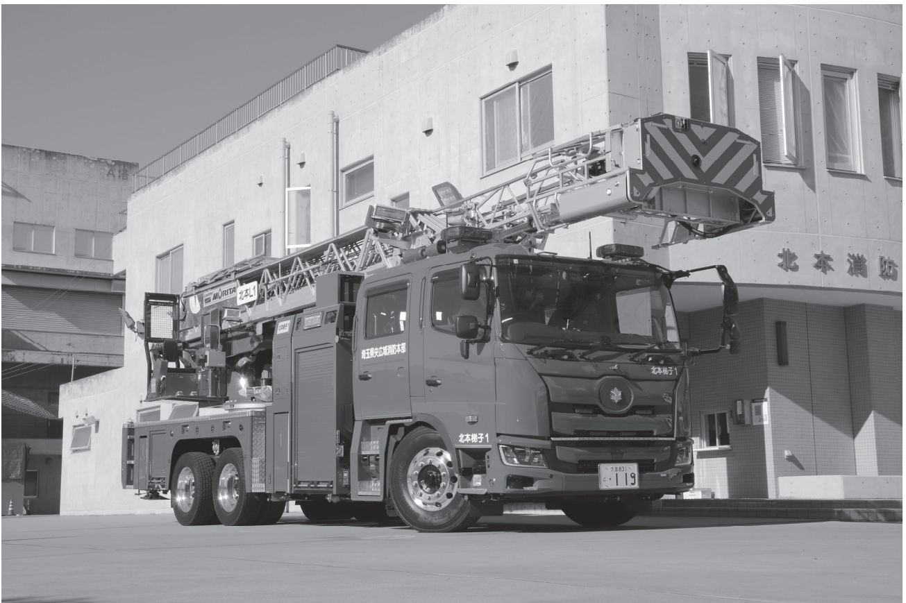
北本消防署はしご付き消防ポンプ自動車（令和5年度更新）