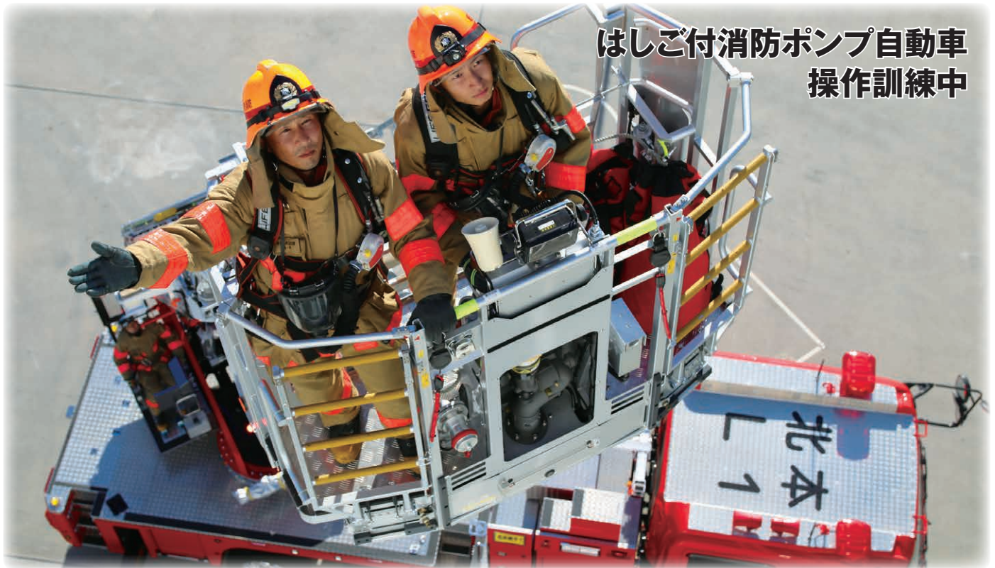
はしご付消防ポンプ自動車 操作訓練中