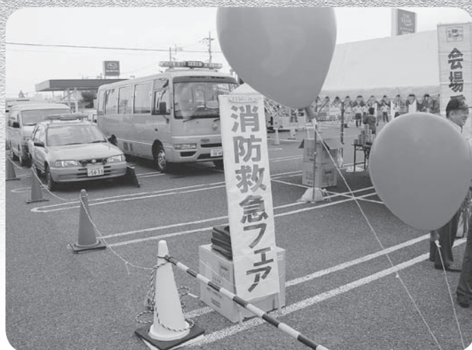
消防・救急フェア受付