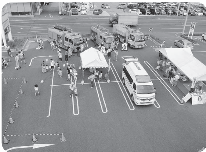
消防車両展示コーナー